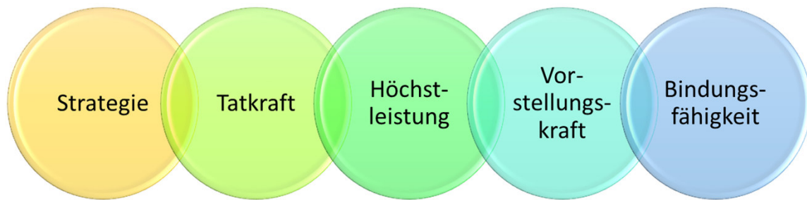
Die fünf Stärkenbereiche des Clifton StrengthsFinders

Das Clifton StrengthsFinder-Instrument wurde entwickelt, um den individuellen Talente-Mix einer Person zu identifizieren. Basierend auf einer Datenbank von mehr als zwei Millionen Interviews, identifiziert diese Analyse aus 5 Stärkenbereichen 34 Talentthemen und liefert damit ein individuelles Stärkenprofil.